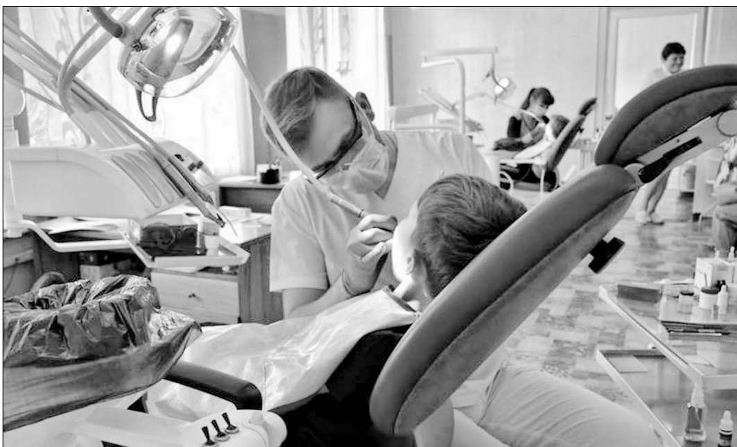
Детские врачи города Красный Луч уже работают на новом оборудовании, доставленном из Башкирии.

Лечили деток наши медики не только в своем передвижном комплексе, но и в местной стоматологической поликлинике, а также выезжали в три села ЛНР. Всего приняли 1774 ребенка, из них больше половины нуждались в профессиональной чистке зубов с применением специальных методов, а в лечении — четвертая часть. Судя по состоянию полости рта маленьких пациентов, которых успели принять башкирские стоматологи, распространение кариеса в регионе составляет 80 — 85 процентов, что свидетельствует о