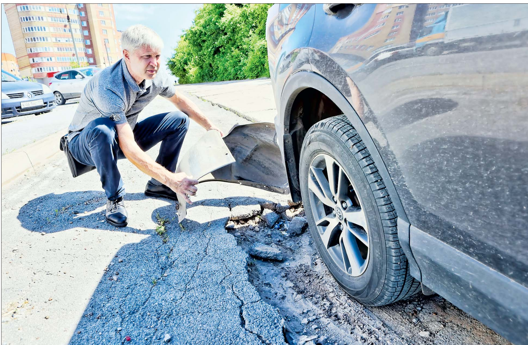
Опять угодил в яму.

За последние три года огорчений уфимским водителям дороги доставляют все меньше, с этим не поспоришь. Но есть «белые пятна», своего рода фигуры дорожного умолчания, о которых знают старожилы и всегда либо сбрасывают газ, либо стараются автоматически, на рефлексе объехать выбоину. Страдают новички и гости столицы. — Вроде и незаметно, что тут что-то не в порядке с дорогой, но эта кажущаяся видимость даже на разрешенной скорости тебя ощутимо тряснет в лучшем случае, в худшем — про-