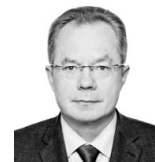
Александр БУЛУШЕВ, министр транспорта и дорожного хозяйства РБ:

— Знаю, что муниципалитеты говорят — до них не доходят средства от министерства. Речь прежде всего о деньгах на содержание дорог, связана эта «узость» с нормативными процедурами. До 10 июля деньги от минтранса дойдут до муниципальных районов. Всего в 2022 году в Башкирии на содержание автодорог регионального, межмуниципального и местного значения предусмотрено 5,7 млрд рублей.