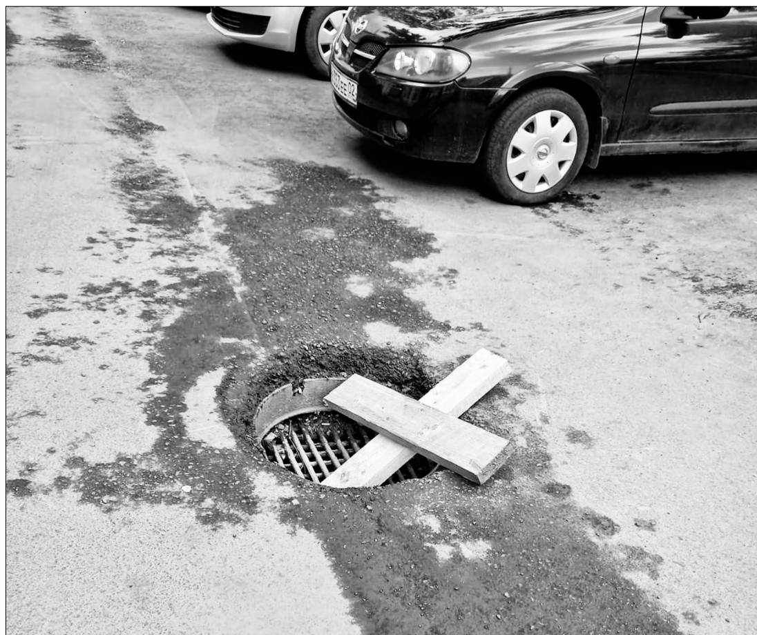
Заехав в такую яму, на подвеске можно ставить крест.

На перекрестке улиц Ветюшинока и Новомостовая нам показывают «лобное место» — периодическое возникающее место дорожного ремонта, где старое покрытие убито, а новым асфальтом еще не заполнено. Часто, даже слишком часто, эти коварные вырезы не обозначаются знаками, а без ущерба проехать по ним можно на скорости 5 — 6 километров в час. Вот и ку-