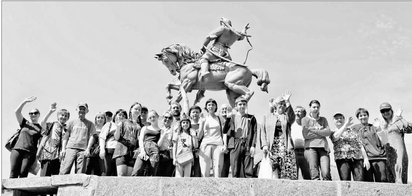
Беженцы из ЛНР на экскурсии, организованной газетой «РБ».