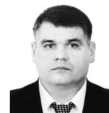
Сергей КОЖЕНИКОВ, замглавы администрации Уфы:

— Знаю, что муниципалитеты говорят — до них не доходят средства от министерства. Речь прежде всего о деньгах на содержание дорог, связана эта «узость» с нормативными процедурами. До 10 июля деньги от минтранса дойдут до муниципальных районов. Всего в 2022 году в Башкирии на содержание автодорог регионального, межмуниципального и местного значения предусмотрено 5,7 млрд рублей.