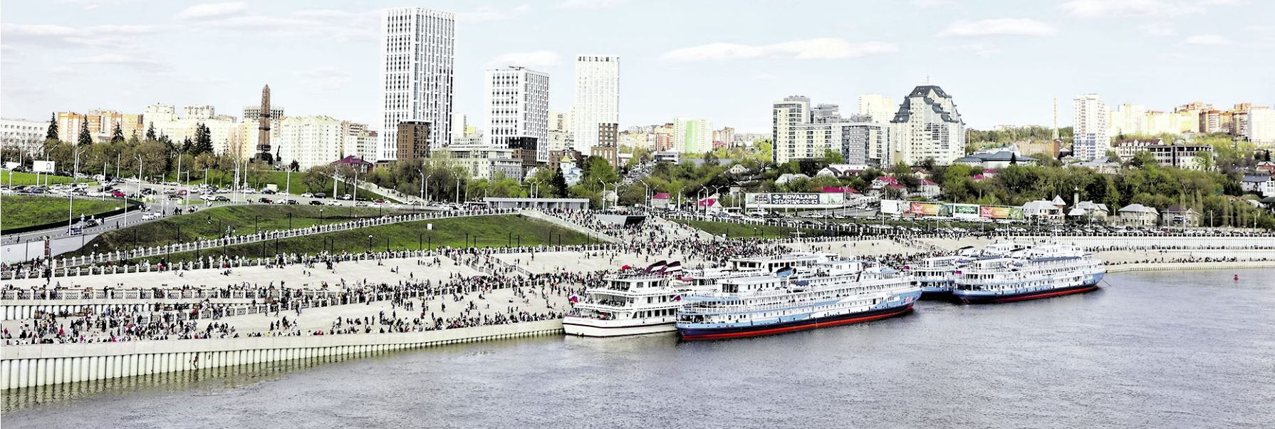
Представьте — вы въезжаете в красивый город на реке, и вас встречает... Иван Грозный. Это сразу запоминается.